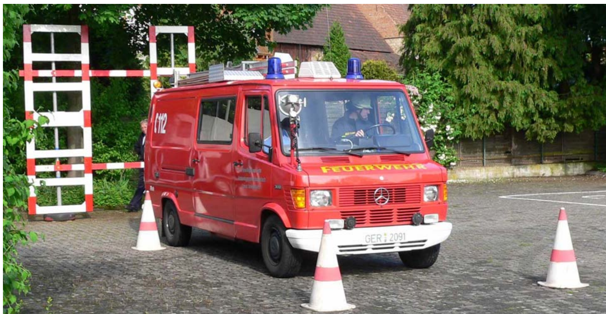
Einfahrt in die Spurgasse und Anhalten am Gatter