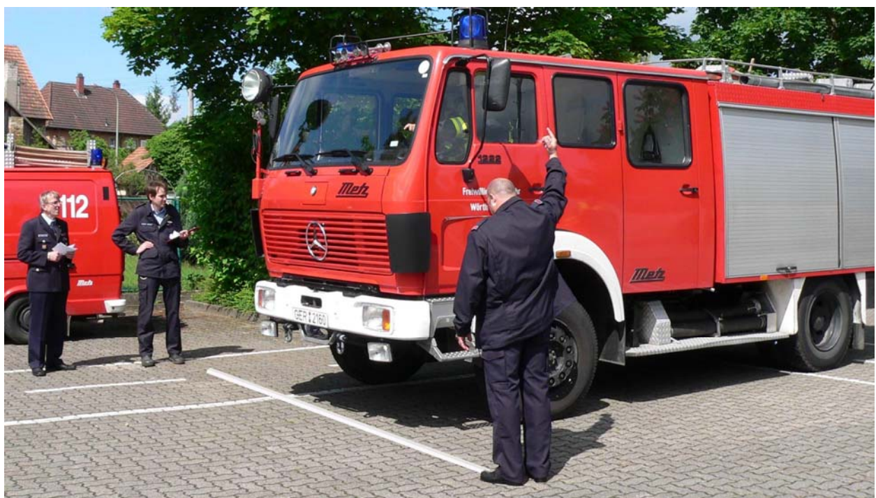
Start der Bewertungsfahrt