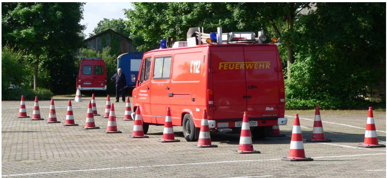
Befahren der Spurgasse

Anhalten in der Spurgasse pro Halt = 10 Fehlerpunkte