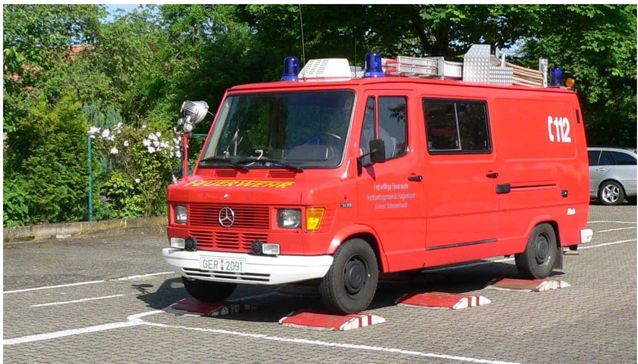
Fahrt über die Schlauchbrücken

Anhalten zwischen den Schlauchbrücken = 25 Fehlerpunkte