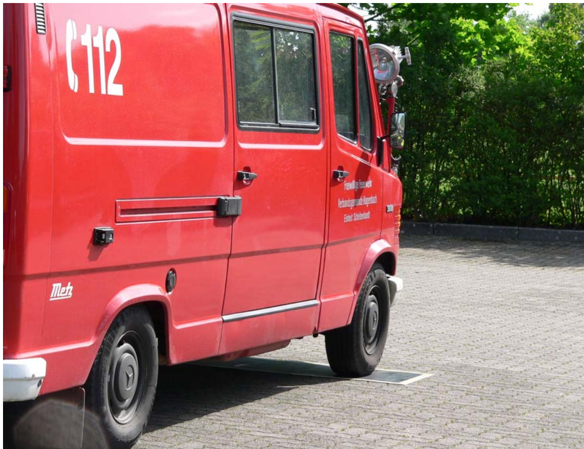
Korrektes Anhalten innerhalb der Markierung