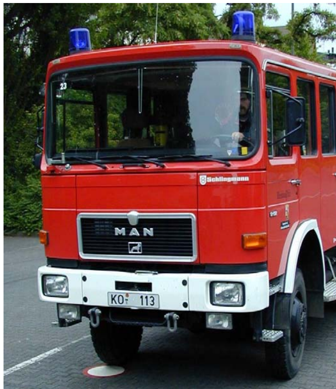
Korrektes Anhalten innerhalb der Markierung

Die Tonnen werden gleichzeitig, langsam von der Fahrbahnmitte auseinander gezogen bis der Fahrer die Bewegung der Tonnen durch Hupen stoppt.