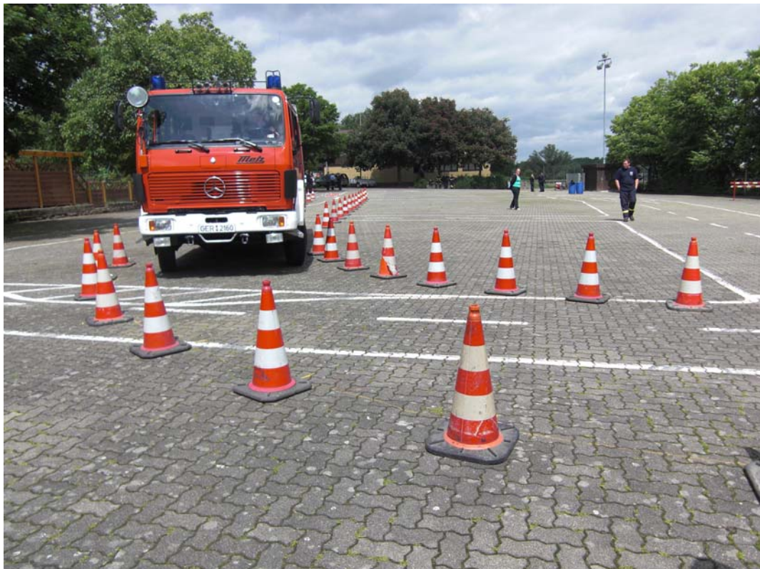
Einfahrt in die Spurkurve

Anhalten in der Spurgasse pro Halt = 10 Fehlerpunkte