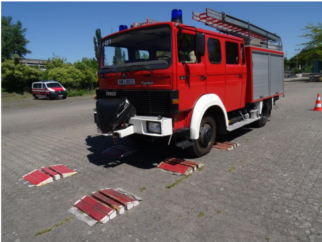
Fahrt über die Schlauchbrücken