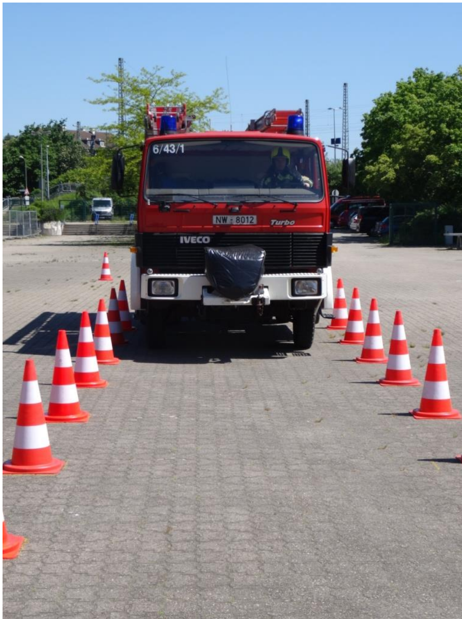
Befahren der Spurgasse

Anhalten in der Spurgasse pro Halt = 25 Fehlerpunkte