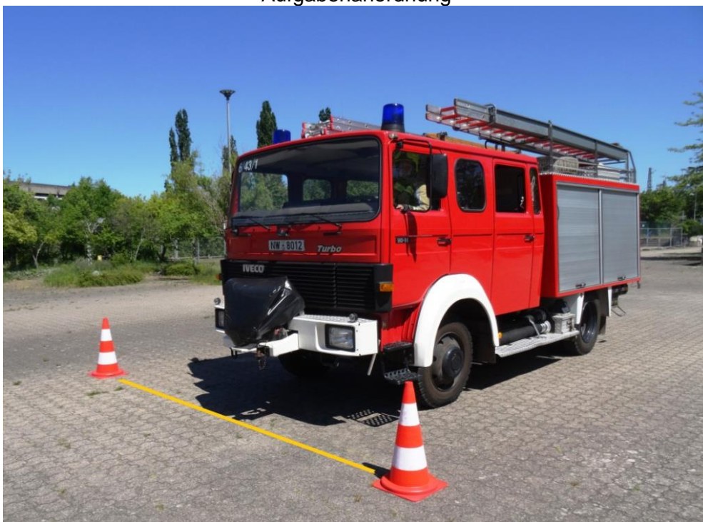
Start der Bewertungsfahrt