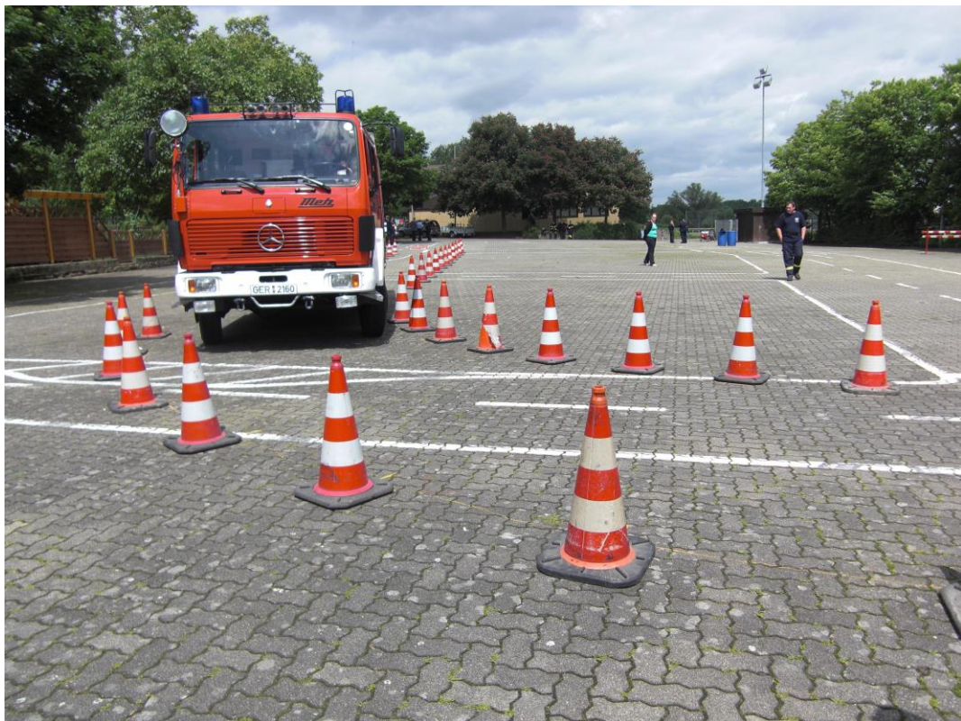
Einfahrt in die Spurkurve

Anhalten in der Spurgasse pro Halt = 25 Fehlerpunkte