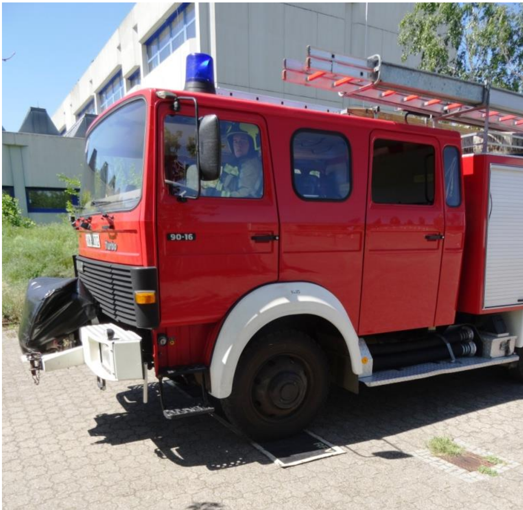
Korrektes Anhalten innerhalb der Markierung