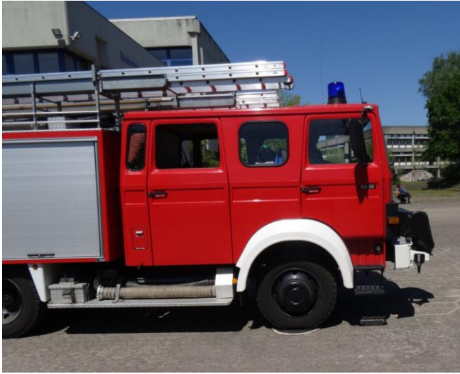
Korrektes Anhalten innerhalb der Markierung

Mit dem rechten Vorderrad auf einer kreisrunden Markierung mit 0,50 m Durchmesser anhalten.