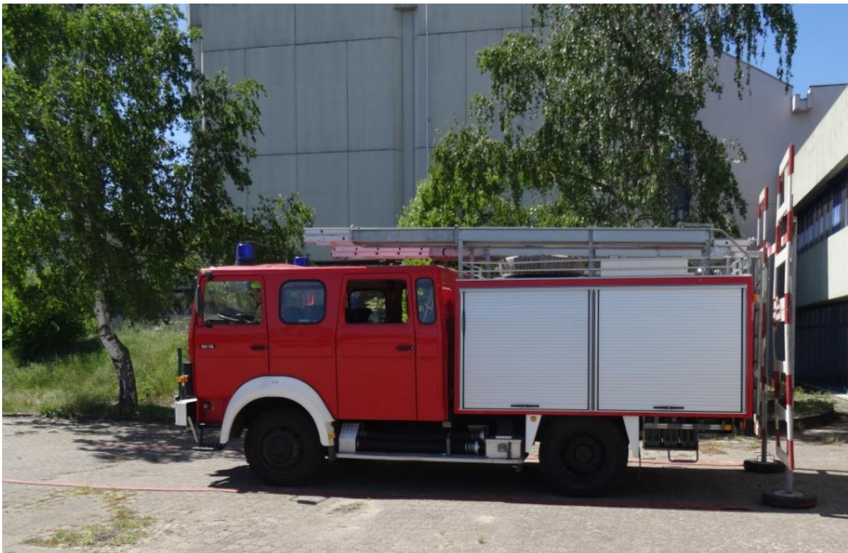
Einfahrt in die Spurgasse und Anhalten am Gatter